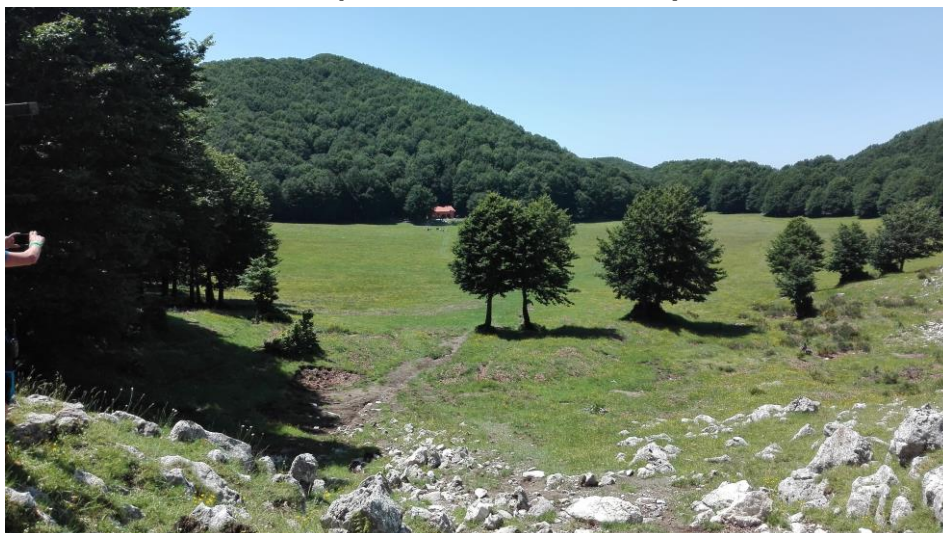
Piano di Lauro visto dall'imbocco del sentiero 208 verso Acqua Fredda