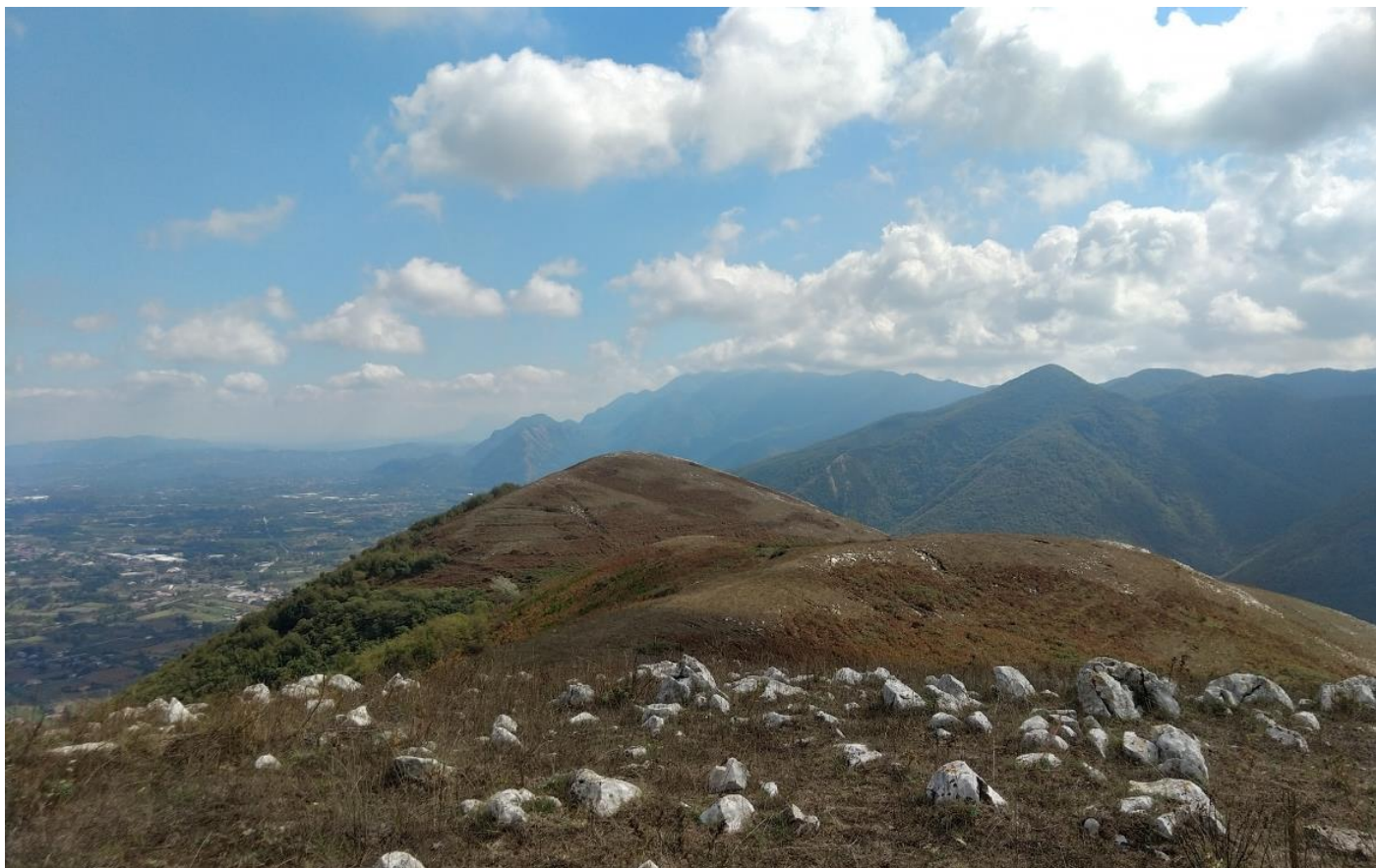
Cresta dei monti Saticulani