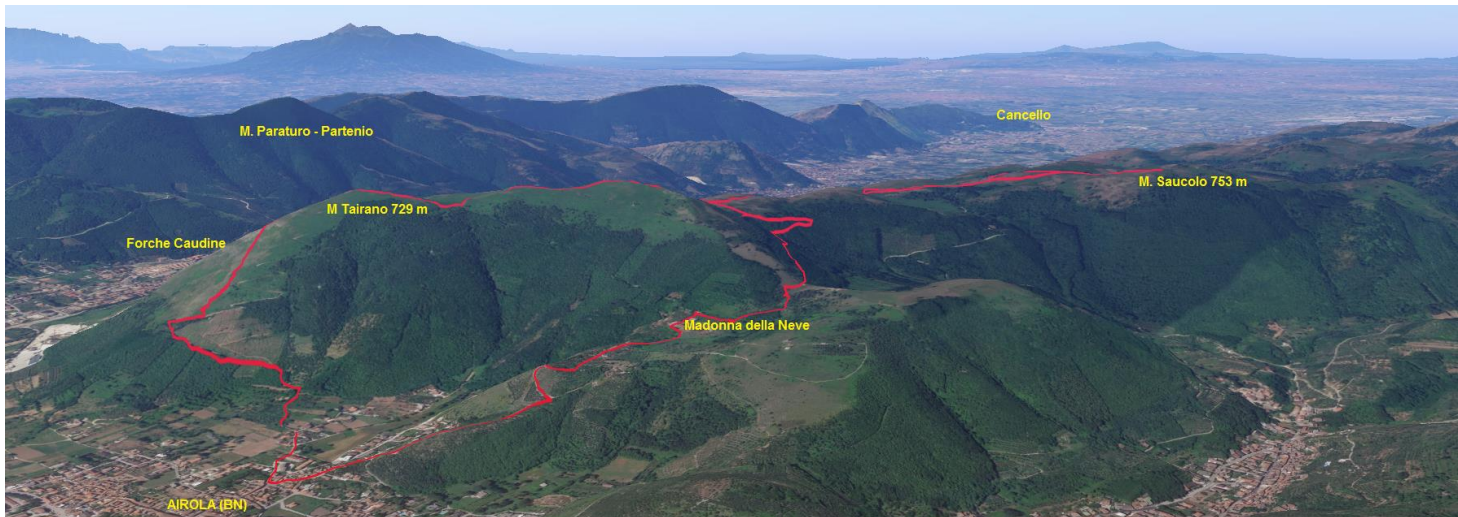
Modello 3D su Base igm