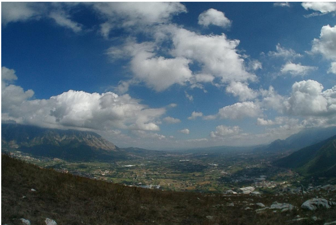
Valle caudina dal monte Tairano