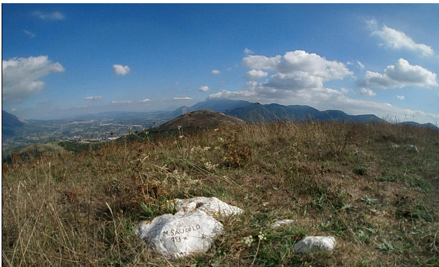
Valle Caudina dal monte Saucolo