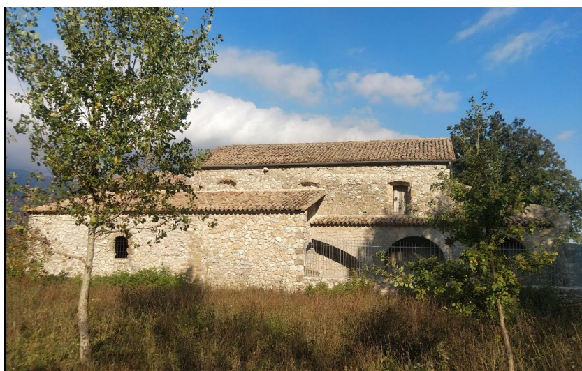
Madonna della neve