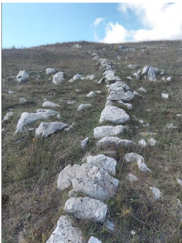
Vecchi insediamenti Caudini